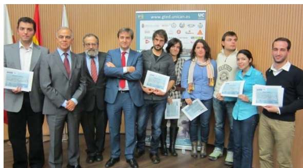
Entrega de los Premios INBISA CONSTRUCCIÓN a los 3 mejores Proyectos del Curso 2012-13 (7ª Promoción).