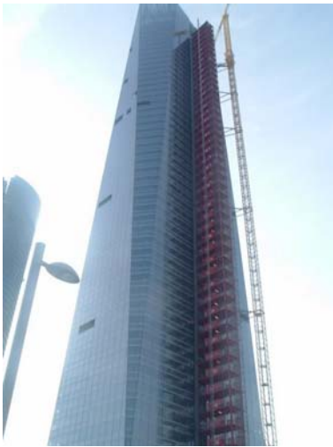
Torre de Cristal: Es el segundo edificio más alto de España y será presentado el próximo 17 de noviembre.

Consejería de Obras Públicas y Vivienda del Gobierno de Cantabria, cuatro Colegios Profesionales y más de sesenta entidades cuyos técnicos colaboran en la docencia y en la transmisión de sus experiencias en el proyecto y ejecución de obras. Intervienen, asimismo, profesores de 7 universidades españolas.