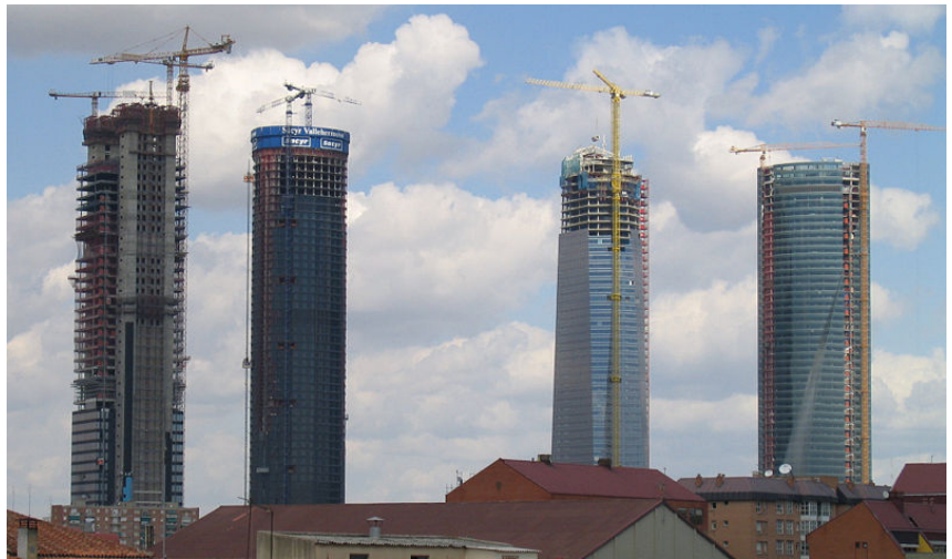
CUATRO TORRES BUSINESS AREA (CTBA) de Madrid - Torre Caja Madrid (izq.), Torre Sacyr Vallehermoso, Torre de Cristal y Torre Espacio: Son record de altura en España y han sido mostradas en las diversas inauguraciones del postgrado de Edificación.