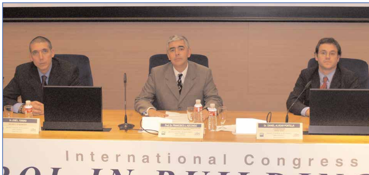
Las palabras durante la Sesión de Clausura hicieron especial énfasis en el trabajo y las interesantes aportaciones del Congreso.