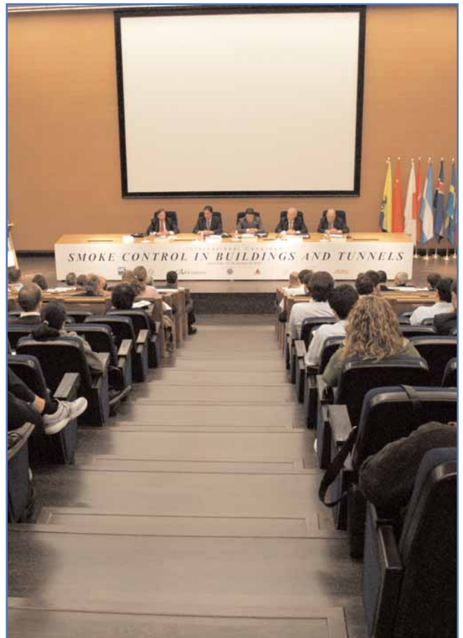
Vista general de la Mesa Presidencial, en el Salón de Actos de la E.T.S. de Ing. Industriales y de Telecomunicación.