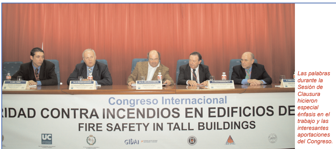
Las palabras durante la Sesión de Clausura hicieron especial énfasis en el trabajo y las interesantes aportaciones del Congreso.