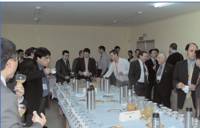
Imagen del Coffee-Break para los participantes de la sesión 1 del Congreso Internacional sobre La Seguridad contra Incendios en Edificios de Gran Altura. El número de participantes en el Congreso se aproximó a las 200 personas.