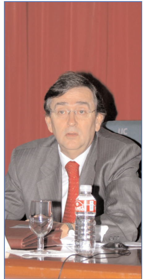
El Excmo. Sr. D. Francisco Javier Velázquez López, Director General de Protección Civil y Emergencias del Ministerio de Interior pronunciando las palabras de apertura del Congreso.