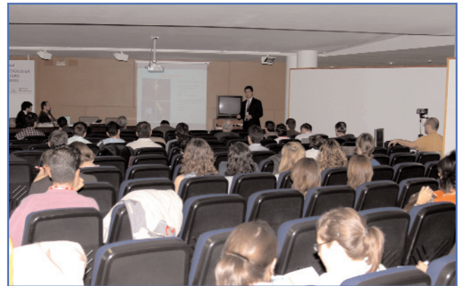
De forma paralela, el Salón de Actos de la E.T.S. de Ingenieros Industriales y de Telecomunicación, fue la sede para las Conferencias agrupadas en las sesiones 2. Las sesiones fueron retransmitidas en directo a través de la Red Internet.