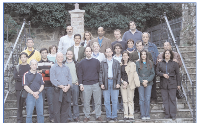
Por cortesía de la Consejería de Turismo, Cultura y Deporte del Gobierno de Cantabria se invitó a los participantes del Congreso a visitar algunas de las zonas más hermosas de Cantabria .