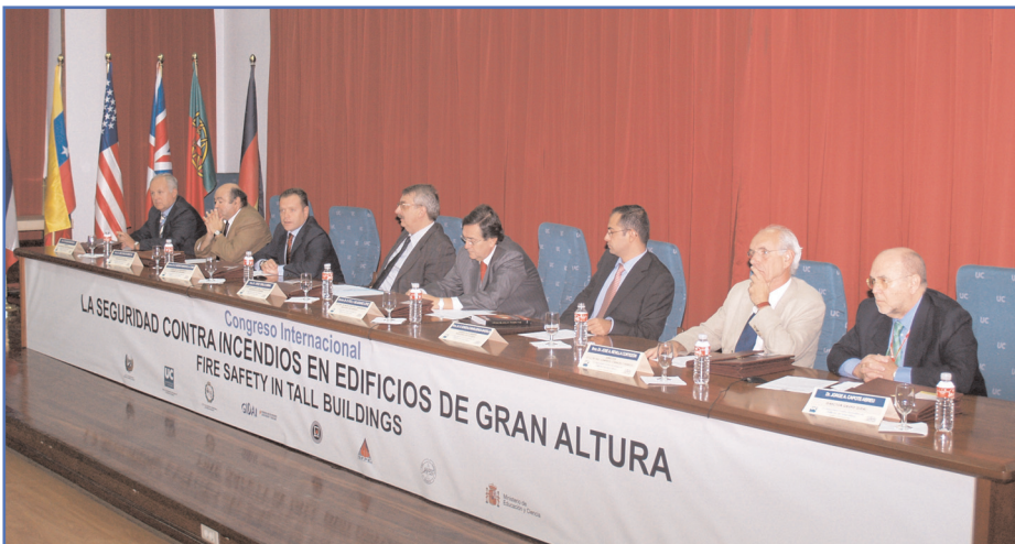
Vista general de la Mesa Presidencial, en el Aula Magna de la E.T.S. de Ing. de Caminos, Canales y Puertos, durante las palabras de apertura de la Sesión Inaugural del Congreso Internacional.