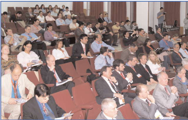
El Salón de Actos de la E.T.S. de Ingenieros de Caminos, Canales y Puertos sirvió de sede principal para los actos conjuntos del Congreso Internacional, y para las Conferencias impartidas durante las sesiones 1. El nivel de asistencia fue excelente.