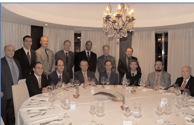
Por cortesía del Excmo. Alcalde de Santander, se invitó a las autoridades y miembros del Comité Científico del Congreso Internacional a una Cena de Bienvenida.